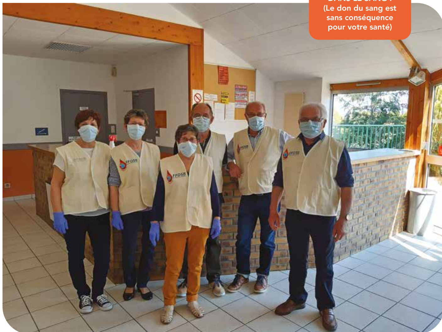
Une équipe de bénévoles prête à accueillir les donateurs, même pendant le confinement

LA VIE, ON A ÇA DANS LE SANG ! (Le don du sang est sans conséquence pour votre santé)