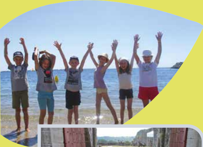
Été 2019 - Mini camp ALSH à La Turballe pour les 7-11ans