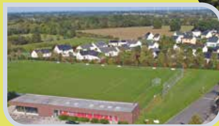
Groupe Scolaire et Stade de football