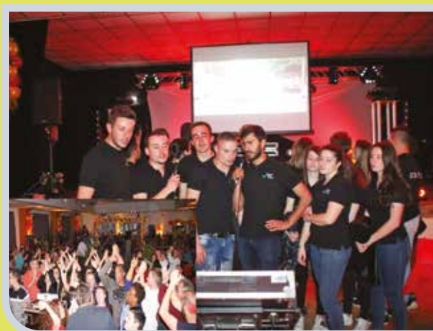
Soirée karaoké et apéro des Jeun's Anim's