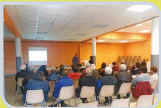
8 Octobre 2019 - Réunion publique sur la mutuelle communale