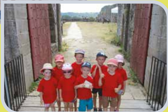
Été 2019 - Mini camp ALSH à Oudon pour les 4-6 ans