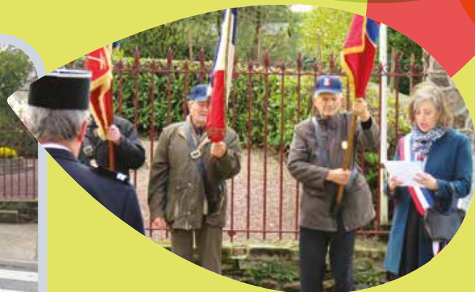
7 Décembre 2019 - Défilé de la Sainte Barbe